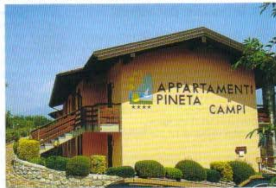
Auswahl: Neben den Hotelzimmern können die Gäste im Pineta Campi auch in die komfortablen Appartements ziehen – Seeblick ist bei den meisten inbegriffen.

Training am Tag auf dem Platz“, sagt der studierte Deutsch- und Englischpädagoge. „Bei uns gibt es keine besondere Philosophie. Bei uns wollen und sollen die Leute Spaß haben.“ Und den haben sie allemal. Das ist sicher einer der Gründe, weshalb die meisten seiner Teilnehmer „Wiederholungstäter“ sind und sich im Pineta Campi so wohl fühlen.