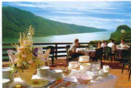
Ausblick: Allein für den Blick von der Terrasse des Pineta Campi lohnt sich die Reise nach Tremosine.