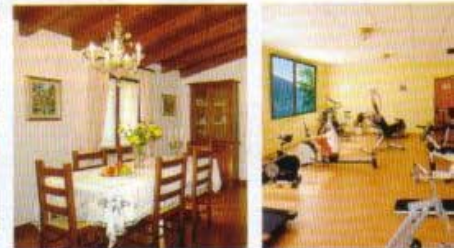
Gemütliche Zimmer, funktionelles Fitnessstudio

Fähre hinüber nach Malcesine. Dort sollte man unbedingt am Samstag auf dem Markt eine Portion frischen Fisch genießen und diese mit einem schönen Wein aus der Region herunterspülen.