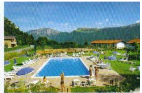
Abkühlung gefällig? Der Pool ist direkt am Hotel.

Außer Tennisspielen im Pineta Campi hat der Gardasee natürlich noch einiges zu bieten. In knapp zehn Minuten ist man im zauberhaften Limone, wo man in winzigen Gassen schlendern und am Hafen (dort passen vielleicht drei oder vier Schiffchen hinein) einen Cappuccino trinken kann. Besonders reizend ist die Fahrt mit der